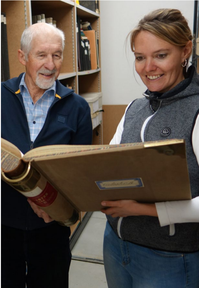
Die beiden Archivre studieren ein altes Katasterbuch.