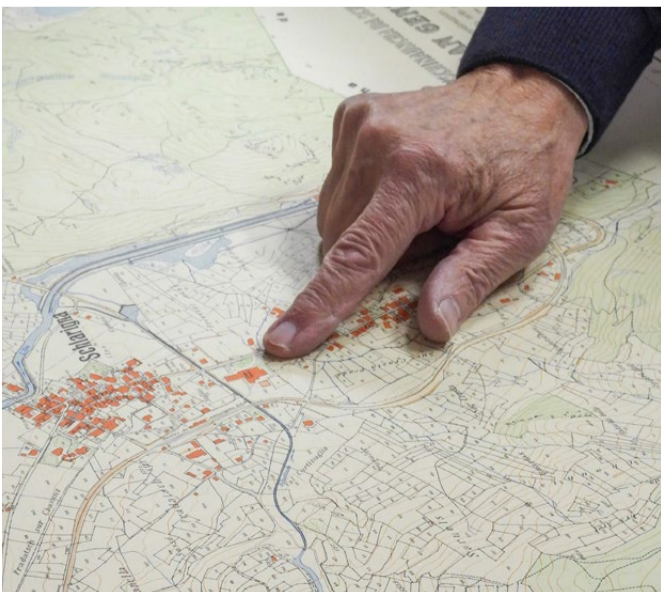
1925 floss der Schlattain noch mitten durchs Dorf.

Die neue Archivarin will darum genau wissen, was auf dem Pergamentblatt aus dem Jahr 1320 steht. Pedrun erzählt es ihr gerne: «Es ist eine Vereinbarung zwischen Celerina und Samedan. Die beiden Dörfer verpflichten sich darin, einander zu helfen, falls es zu Überschwemmungen des Flaz kommt.»