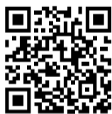
Verkehrs- und Parkierungskonzept

Die dynamischen Tafeln zeigen den Status (frei/besetzt) an, jedoch nicht die konkrete Anzahl verfügbarer Parkplätze. Die Gemeinde will nun Erfahrungen sammeln und anschliessend prüfen, in welcher Form das Parkleitsystem erweitert werden kann.